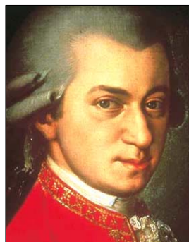
Wolfgang Amadeus Mozart (1756-1791)