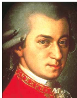
Wolfgang Amadeus Mozart (1756-1791)