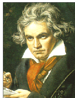
Ludwig van Beethoven (1770-1827)

Im Gegensatz zum Barock ist die Musik weltlicher und tänzerischer ausgerichtet. Die kirchliche Dominanz verliert an Gewicht. Adel und Bürgertum werden zu Kulturträgern.