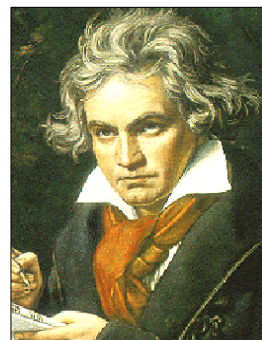
Ludwig van Beethoven (1770-1827)

Im Gegensatz zum Barock ist die Musik _____ ausgerichtet. Die kirchliche Dominanz verliert an Gewicht. _____ werden zu Kulturträgern.